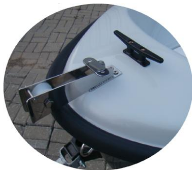
* winda kotwiczna (rolka) INOX mała do ciężarka 5 kg