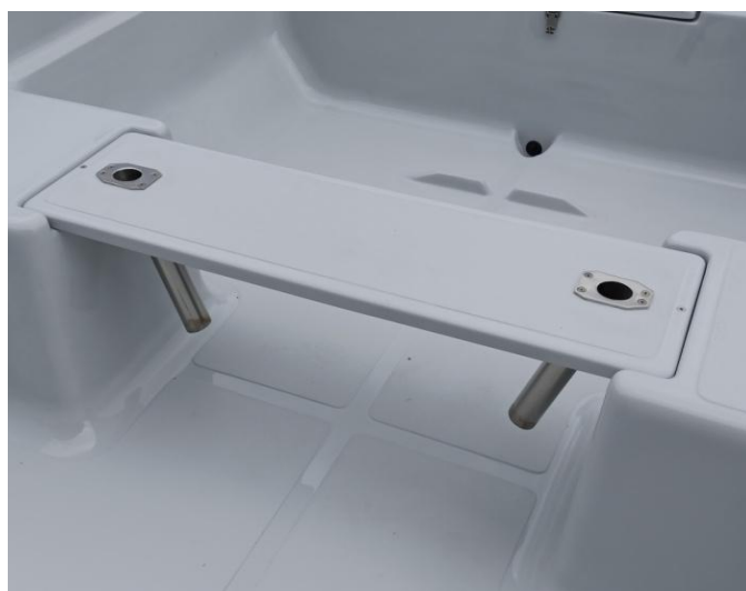
* 2x gniazda wędek INOX z dostępne są tylko gniazda wędek INOX z korkiem zatykowym