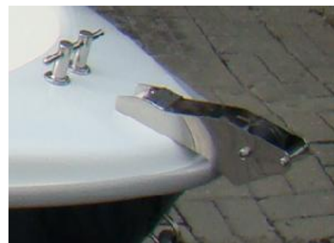
* winda kotwiczna (rolka) INOX duża do ciężarka 14 kg