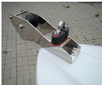
* winda kotwiczna (rolka) INOX duża z samozaciskiem i uchem INOX do ciężarka 14