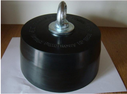
* ciężarek w oprawie gumowej 14 kg