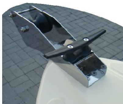
* winda kotwiczna (rolka) INOX duża z knagą rogową PCV do ciężarka 14 kg