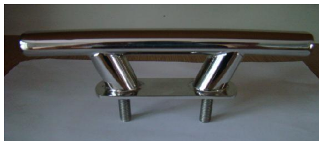
* 2x knagi INOX "rurkowa"