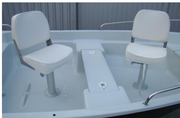
* 2x składane obrotowe fotele