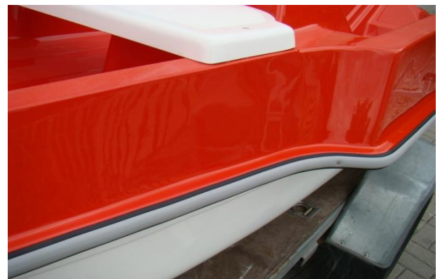
* listwa odbojowa 2-częściowa + zakończenia INOX