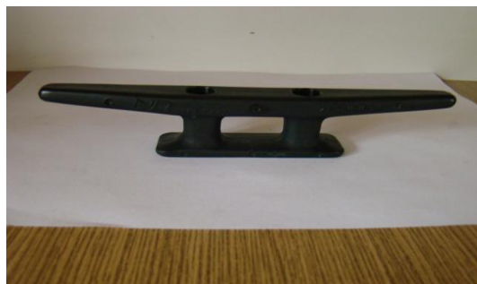
* 2x knagi PCV czarne