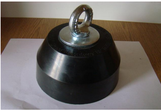
* ciężarek w oprawie gumowej 5 kg