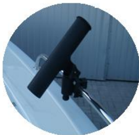
* 2x gniazda wędki PCV mocowane na reling