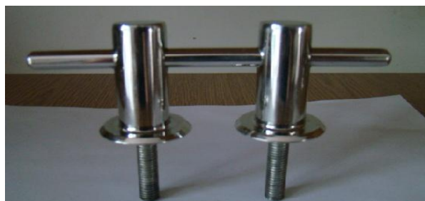
* 2x knagi INOX "prętowa"