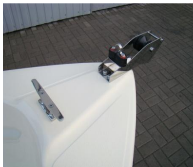
* winda kotwiczna (rolka) INOX duża z samozaciskiem i uchem INOX do ciężarka 14 kg