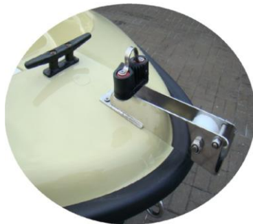
* winda kotwiczna (rolka) INOX mała z samozaciskiem i uchem INOX do ciężarka 5 kg