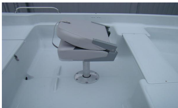
* składany obrotowy fotel