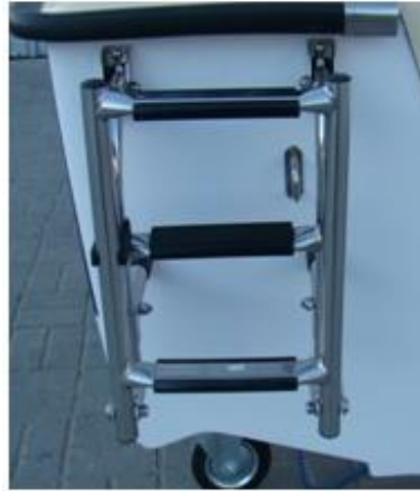
* drabinka 3-stopniowa rozkładana INOX, montowana z lewej strony