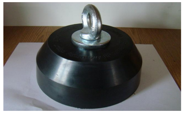
* ciężarek w oprawie gumowej 9 kg