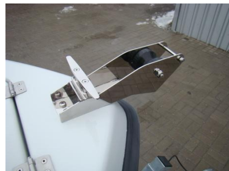
* winda kotwiczna (rolka) INOX duża z knagą rogową INOX do ciężarka 14 kg