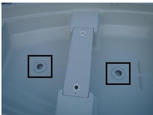
2x gniazda pod nogi foteli + wzmocnienie w podłodze, montaż i uszczelnienie