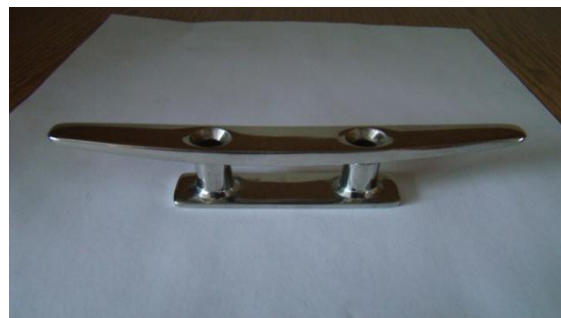
* 2x knagi INOX "rogowa"