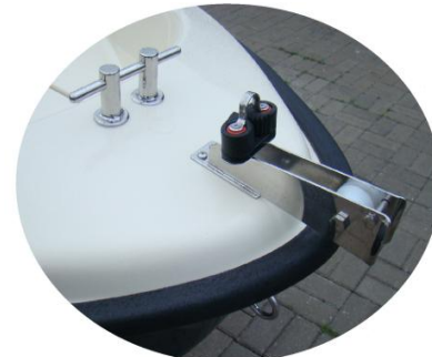
* winda kotwiczna (rolka) INOX mała z samozaciskiem i uchem INOX do ciężarka 5 kg