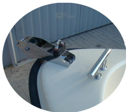
* winda kotwiczna (rolka) INOX duża z samozaciskiem i uchem INOX do ciężarka 14 kg