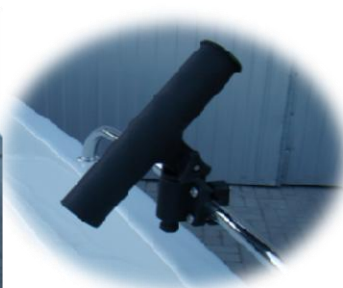
* 2x gniazdo wędki PCV mocowane na reling