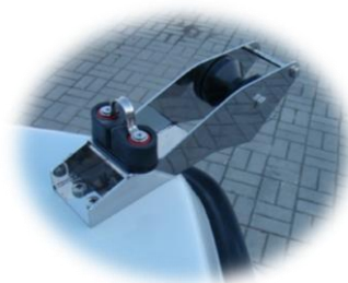
* winda kotwiczna (rolka) INOX dziobowa/duża z samozaciskiem i uchem INOX