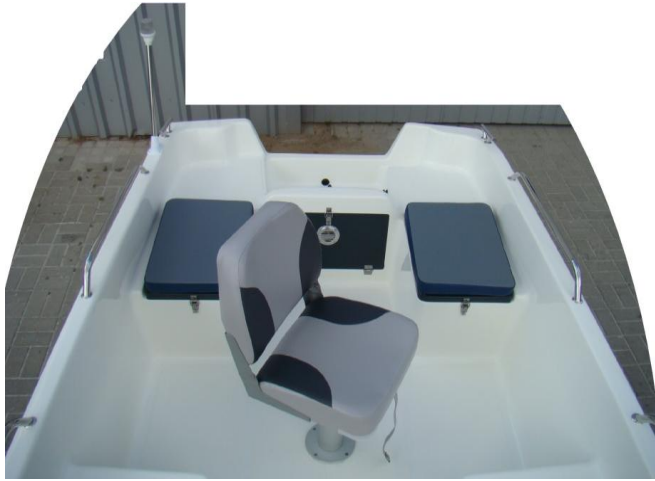
kompletny fotel obrotowy z tyłu