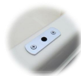
* 2x gniazda dulek z montażem i wzmocnieniem w łodzi