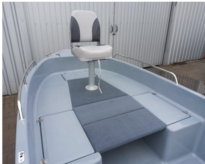
pokład wędkarski z obrotowym fotelem