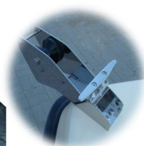
* winda kotwiczna (rolka) INOX dziobowa/duża z