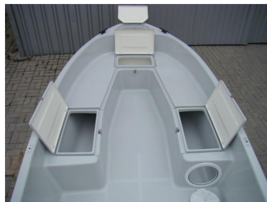
* dodatkowe drzwiczki w prawej