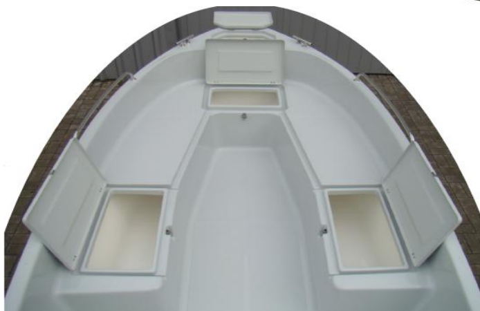
4 schowki z przodu łodzi w tym dwa o długości 130 cm każdy