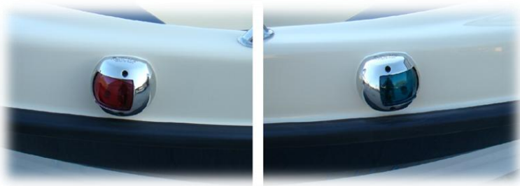
lewa i prawa lampka nawigacyjna INOX