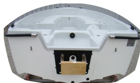
pantograf stały INOX do montażu silnika ze stopą S