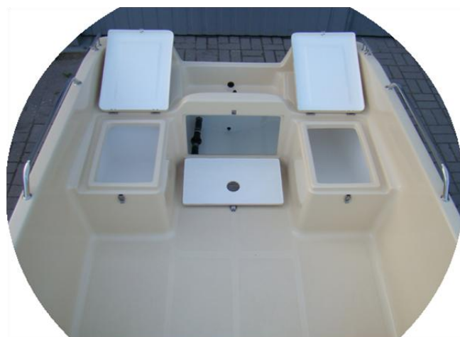
3 schowki z tyłu łodzi