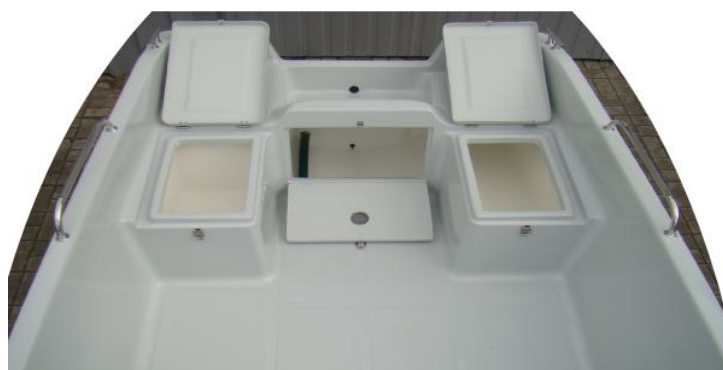
3 schowki z tyłu łodzi