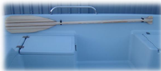
* pagaj z uchwytami