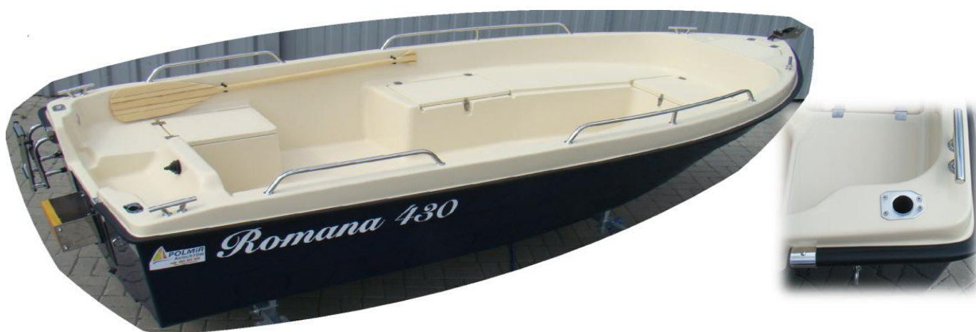
gniazdo wędki zamykane