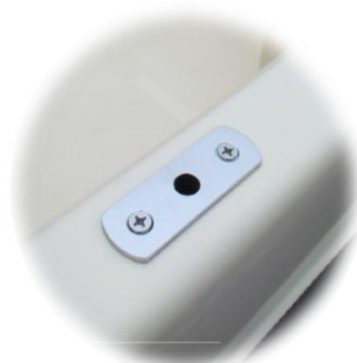
* 2x gniazda dulek z montażem i wzmocnieniem w