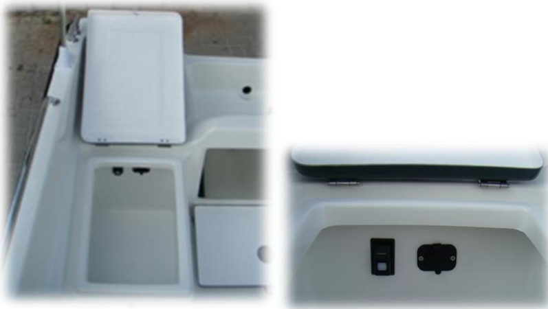
włącznik oświetlenia nawigacyjnego + gniazdo 12 V