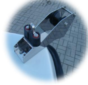
* winda kotwiczna (rolka) INOX dziobowa/duża z samozaciskiem i