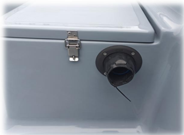
wyście do echosondy oraz kanały do przeprowadzenia przewodów