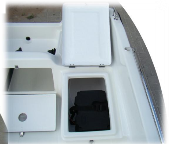
* skrzynka akumulatorowa