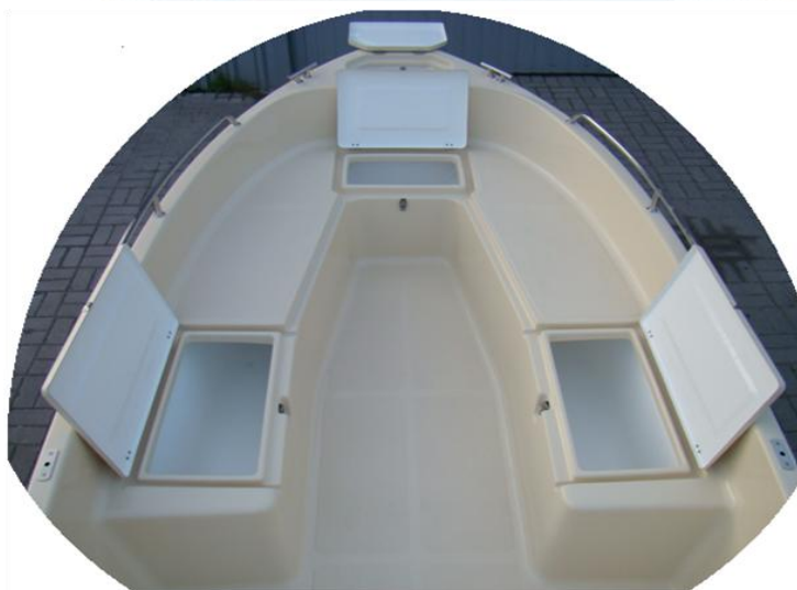
4 schowki z przodu łodzi w tym dwa o długości 130 cm każdy