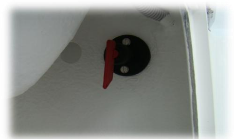
* główny włącznik prądu (hebel)