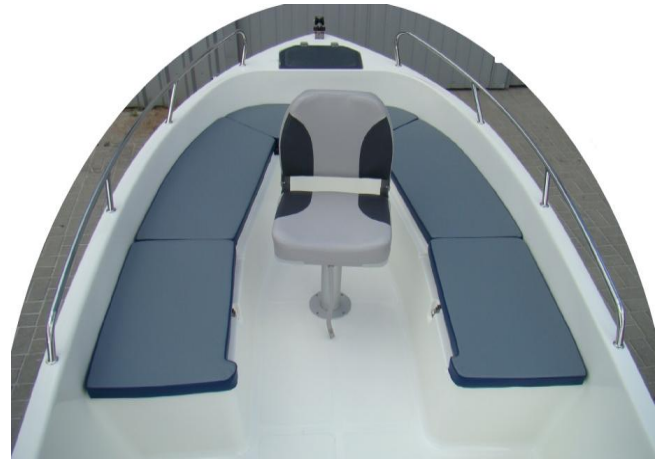
kompletny fotel obrotowy z przodu