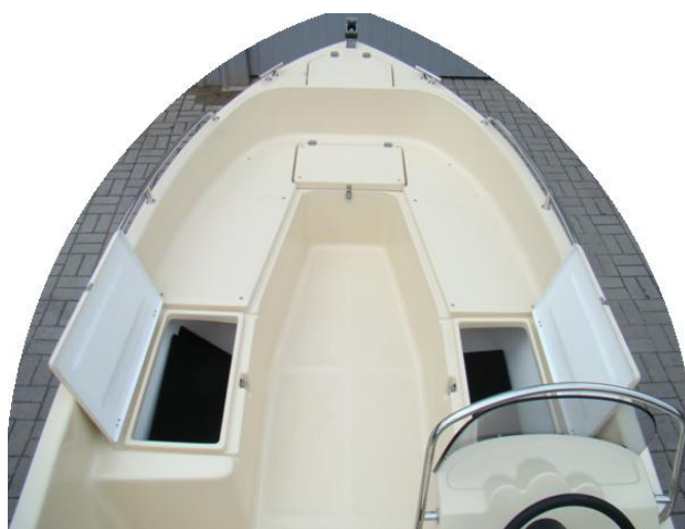
elementy pokładu słonecznego mieszczą się do bocznych schowków