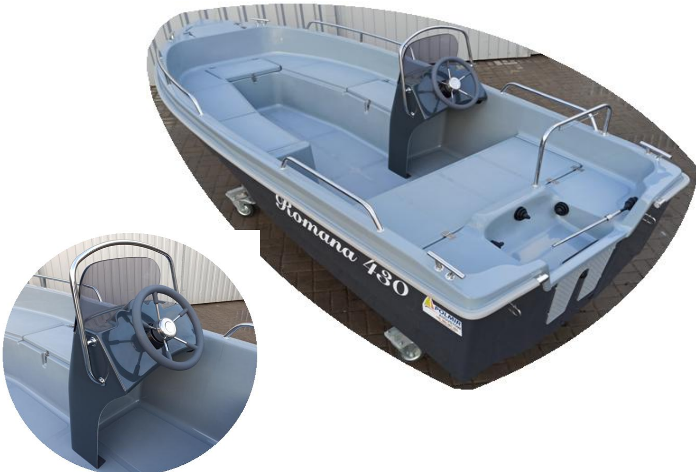
wyróżniająca się z pokładu konsola z szarą kierownicą INOX