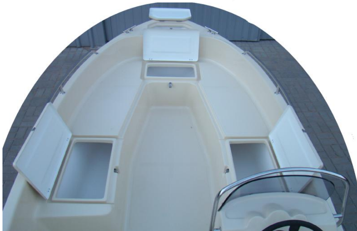
4 schowki z przodu łodzi