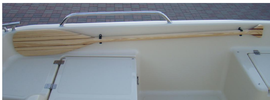
* pagaj z uchwytami