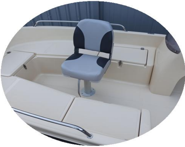
wyjmowany fotel obrotowy