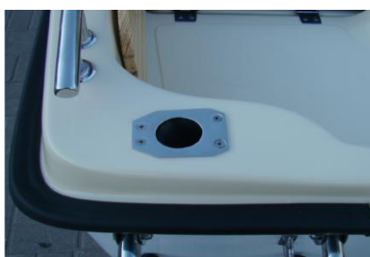
* 2x gniazdo wędkę INOX zamykane korkiem