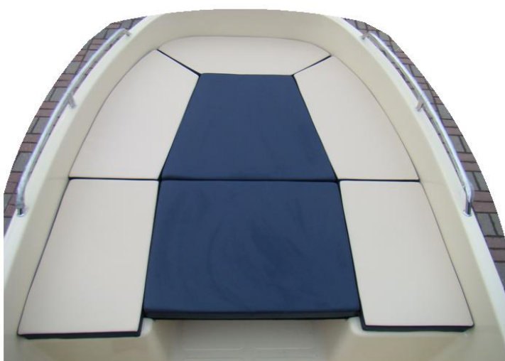
materace na siedzenia U-przód (kremowe z granatową wstawką) oraz materace na pokład słoneczny (granatowe)