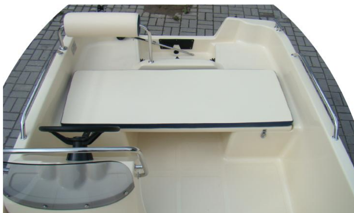
materac na dużą klapę i poduszka na oparcie (kremowe z granatową wstawką)