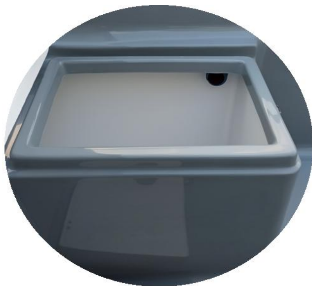
kanał w bakiście do przeprowadzenia instalacji elektrycznej