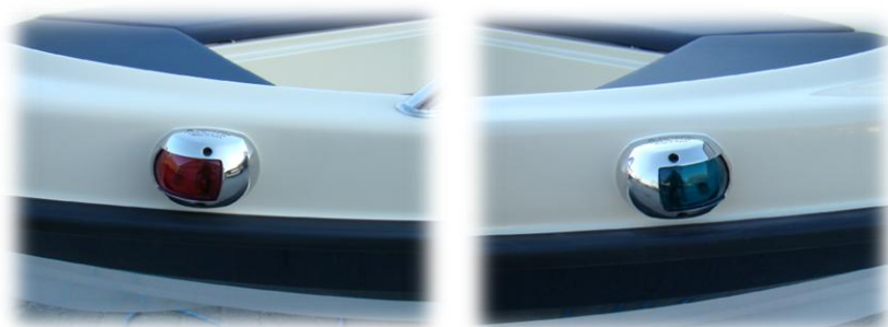
prawa i lewa lampa INOX

cena netto 24 850 zł cena brutto 30 566 zł