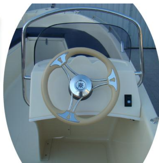
kompletna konsola z kierownicą kremową INOX z włącznikiem lampek + listwa osłonowa konsoli