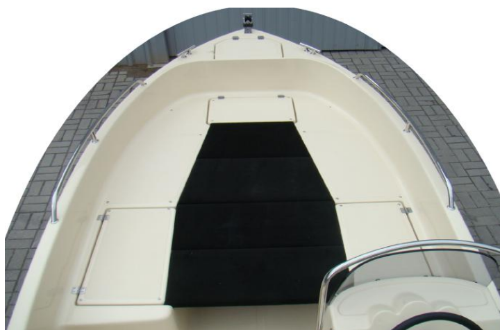
* pokład słoneczny/wędkarski 4 części ze sklejki wodoodp obity filcem