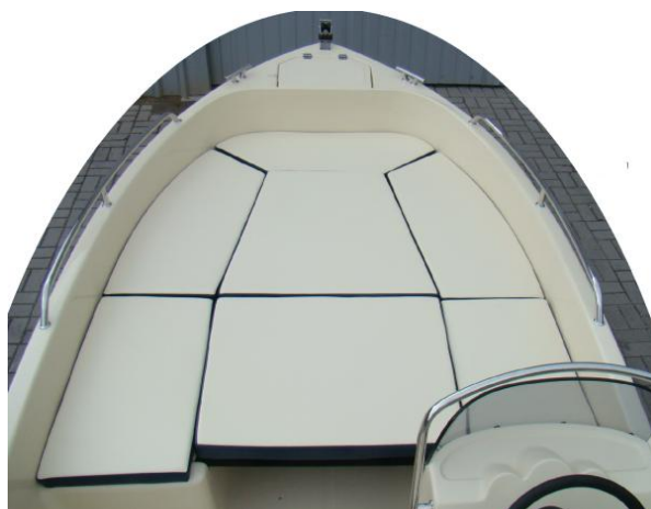
materace siedzenia U-przód (5 części) (kremowe z granatową wstawką) i materace na pokład słoneczny (2 części) (kremowe z granatową wstawką)