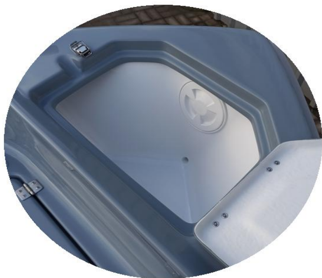
luk holta do montażu silnika na dziobie