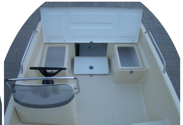
3 schowki z tyłu łodzi i duża kłapa