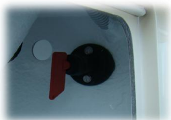
główny włącznik prądu (hebel)