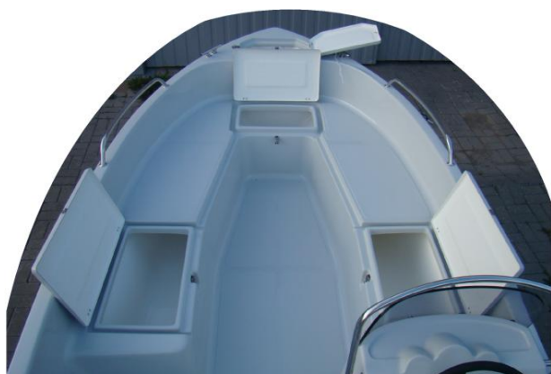
4 schowki z przodu łodzi