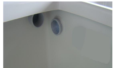
kanały do przeprowadzenia przewodów