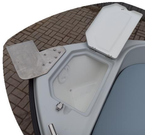
podstawka pod silnik elektryczny na dziobie