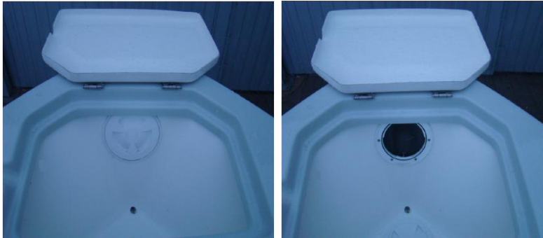
luk holta (rewizja) w schowku dziobowym