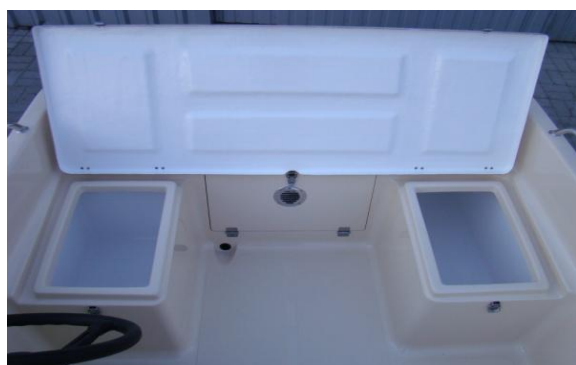
3 schowki z tyłu łodzi