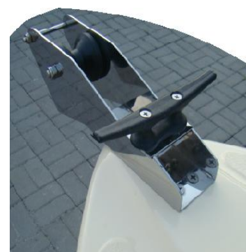
* winda kotwiczna (rolka) INOX duża z knagą rogową PCV do