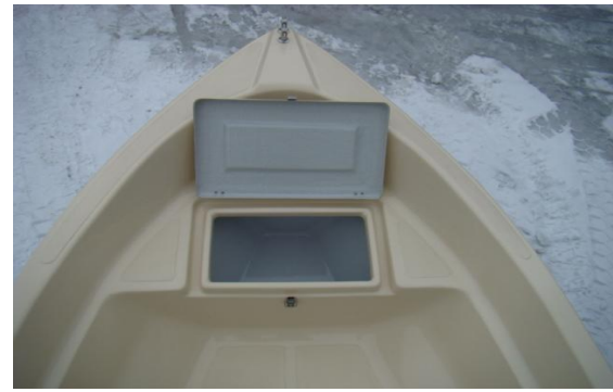
schowek z przodu łodzi