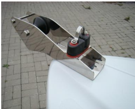
* winda kotwiczna (rolka) INOX duża z samozaciskiem i uchem INOX do ciężarka 14 kg