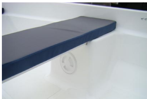
dodatkowy schowek pod środkową ławką