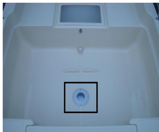
* wzmocnienie w podłodze + montaż +