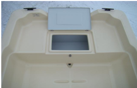
schowek z tyłu łodzi