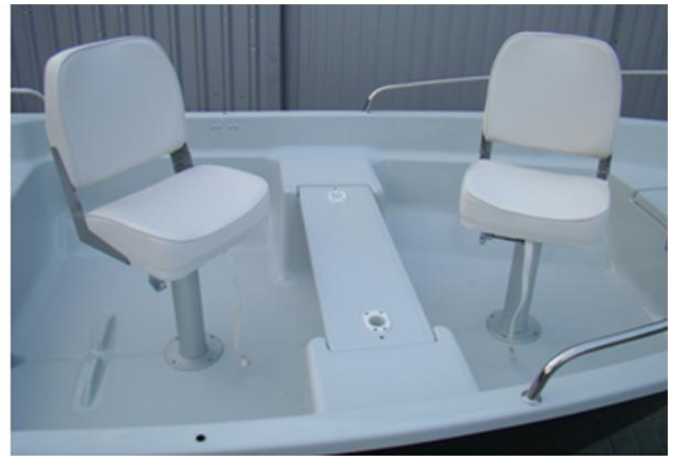
składane obrotowe fotele