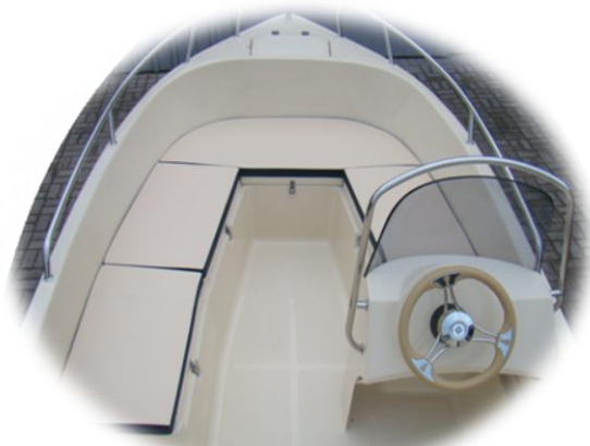
materace na U-siedzenia przód