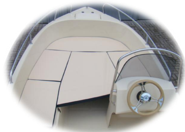
materace na U-siedzenia przód oraz materac na pokład słoneczny