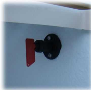
główny włącznik prądu (hebel)