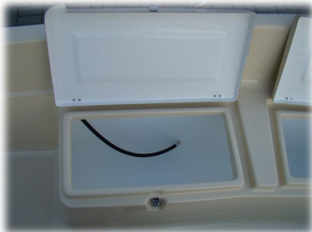
przewód paliwowy w lewej środkowej bakiście