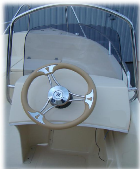
WYŻSZY reling INOX i WYŻSZA szybka-plexa na konsoli