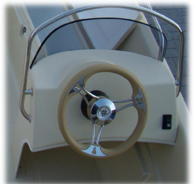
konsola z kremową kierownicą + włącznik lampek