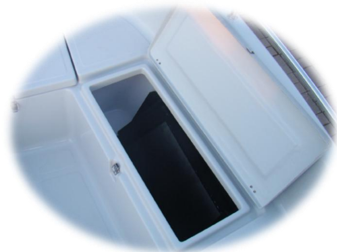
pokład słoneczny mieści się do prawej bakisty

* pokład słoneczny/wędkarski 3 części ze sklejki wodoodp cena 1 200 zł z obiciem (konsola do przodu)