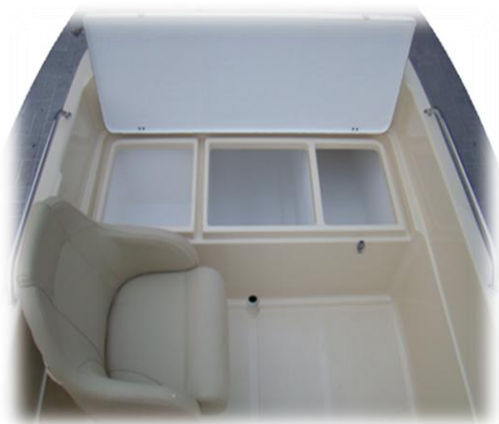
3 schowki z tyłu pod dużą klapą