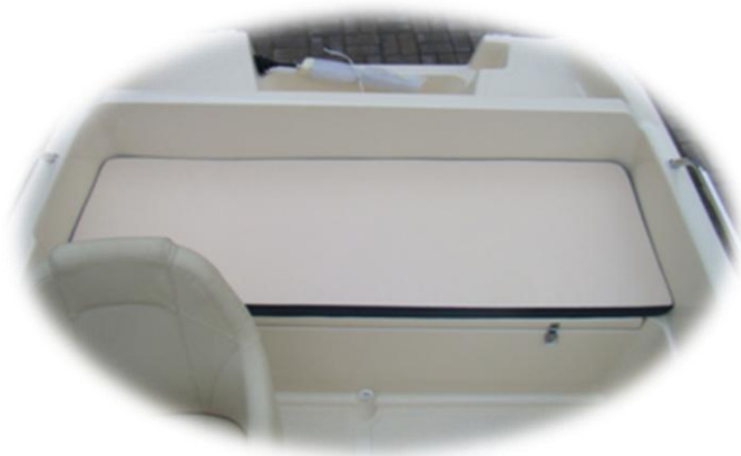
materac na dużą klapę z tyłu