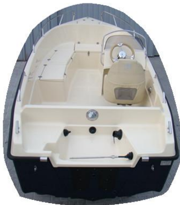
wersja łodzi z kremową kierownicą INOX dopłata netto 100 zł

Cena podstawowa 24 600 zł netto 30 258 zł brutto