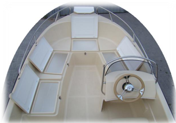
4 schowki z przodu w tym jeden o długości 180 cm