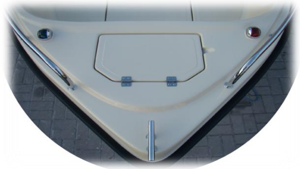
lewa i prawa lampka nawigacyjna