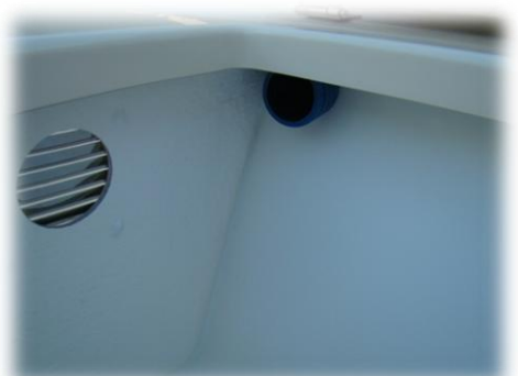
kanał do linii paliwowej od tyłu do lewego środkowego schowka + kratka wentyl. INOX