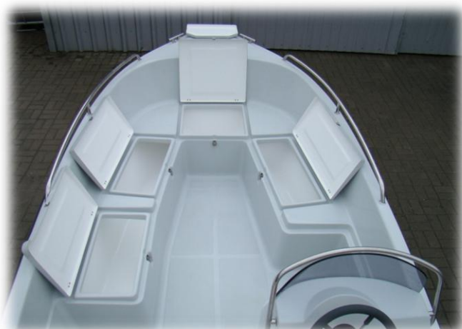
4 schowki z przodu w tym jeden o długości 180 cm