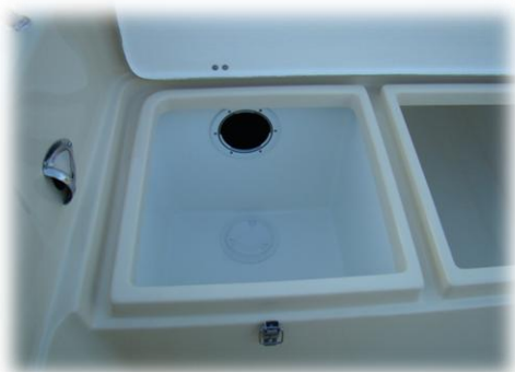
luk holta w schowku sternika