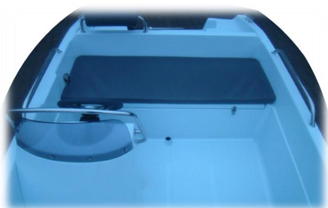
materac na dużą ławkę