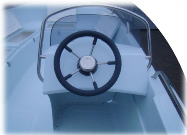
konsola z szarą kierownicą INOX