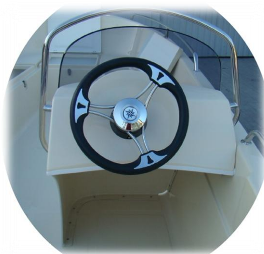
konsola z czarną kierownicą INOX