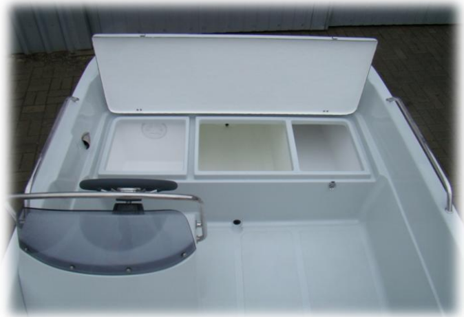
3 schowki z tyłu pod dużą klapą