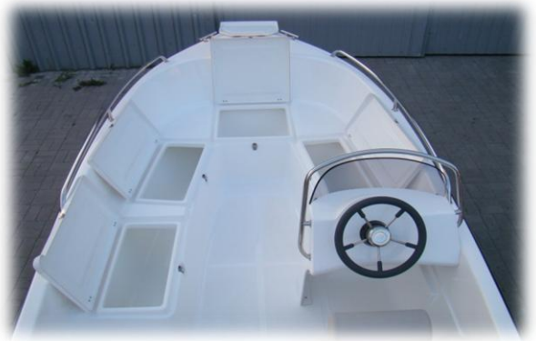
4 schowki z przodu łodzi w tym jeden o długości 180 cm