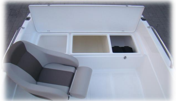
3 schowki z tyłu łodzi

Cena podstawowa 24 900 zł netto 30 627 zł brutto