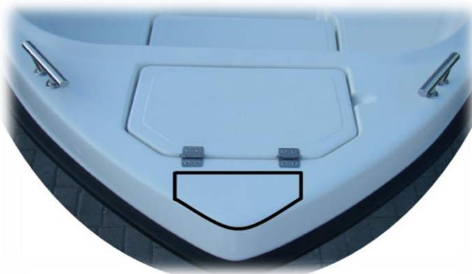
wzmocnienie dziobu pod silnik elektryczny