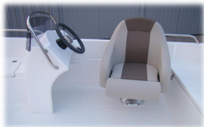
fotel sternika na suwnicy