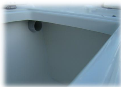
kanały do przeprowadzenia przewodów